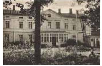
Tuffa ajeli eläkevuosinaan mopedillaan pitkiäkin matkoja Porista sukuloimaan muualle Satakuntaan (kuva vasemmalla). Keskellä Kämpän kaffetupa ja oikealla vanha kuva Vuojoen kartanosta.

Vuojoen kartanon sivutilalla Verkkokarissa oli satama, josta puutavaraa laivattiin Raumalle ja ulkomaille. Ahvenanmaalaiset kaljaasit kuljettivat koivuhalkoa Tukholmaan polttopuuksi. Kuudesta tehtiin kuitupuuta, männystä tuli monenlaista tavaraa, muun muassa kaivospölkkyä Englantiin. Vuojoki yhtiöllä oli tervahöyry, joka kuljetti pinotavaraa määräsataamiin kotimaassa. Niihin aikoihin puutavaraa tarvittiin paljon lämmitykseen. Satamasta uitettiin tukkeja Raumalle Sampaanalan lahden rannalle Vuojoki Gods yhtiön sahalaitekseen. Vuonna 1915 perustettu Rauma Wood tuli Vuojoki Gods -yhtiön ja metsäradan omistajaksi.